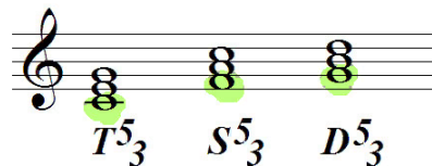
Главные трезвучия лада в До мажоре

Трезвучия на главных ступенях, которые мы с вами построили, называются главными трезвучиями лада. В них есть все звуки тональности. А ещё одна интересная их особенность заключается в том, что в мажорных тональностях главные трезвучия – большие, то есть мажорные; в минорных тональностях они малые, то есть минорные. Таким образом, главные трезвучия не только концентрируют в себе основные силы тональности, но ещё и прекрасно характеризуют её лад – мажорный или минорный.